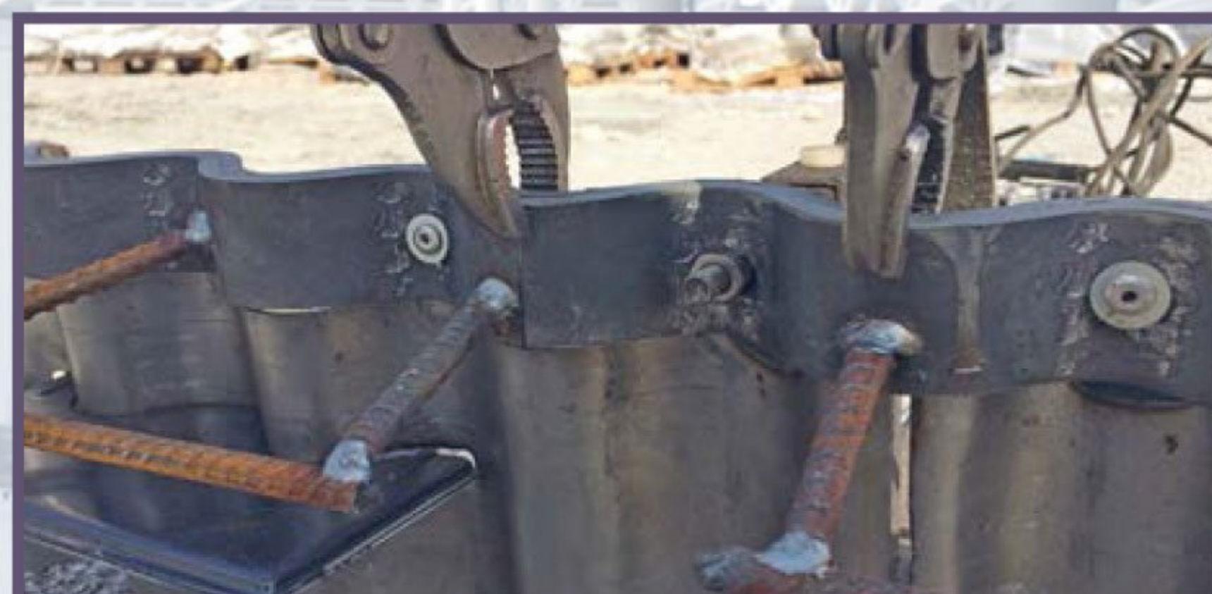
8 Соединение стыков опалубки пинцетами для исключения зазоров по вертикали.