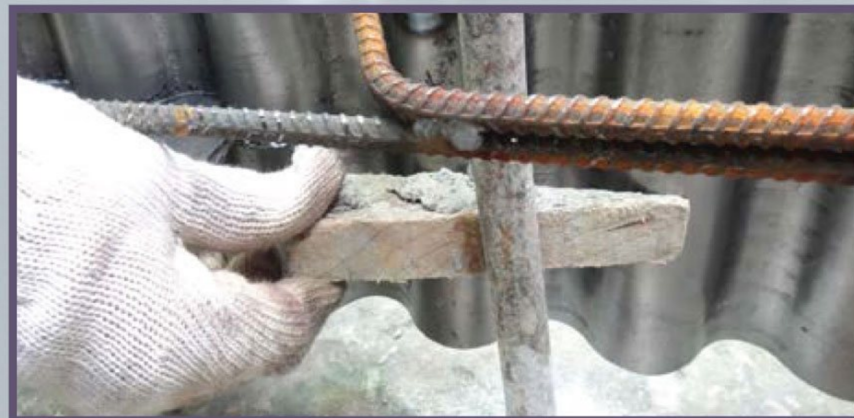
10 Установка треугольных деревянных клиньев между опалубкой и штырями для выравнивания по вертикали и компенсации давления бетона.