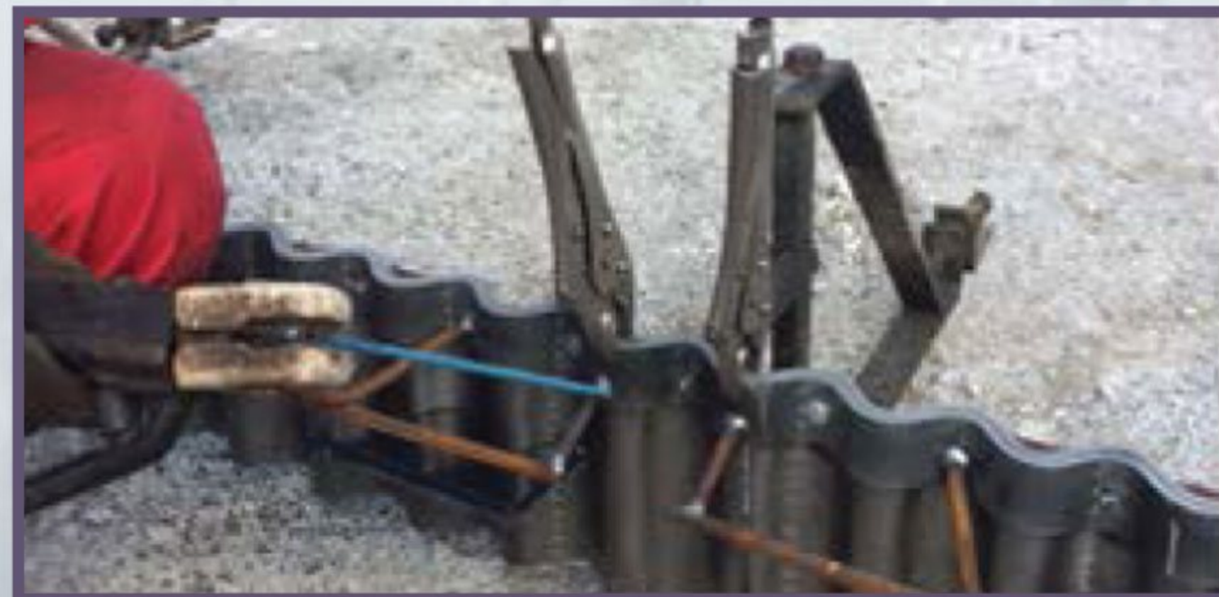
9 Сварка стыка с обеих сторон. Проваривать полностью стык синусоидной полосы не нужно.