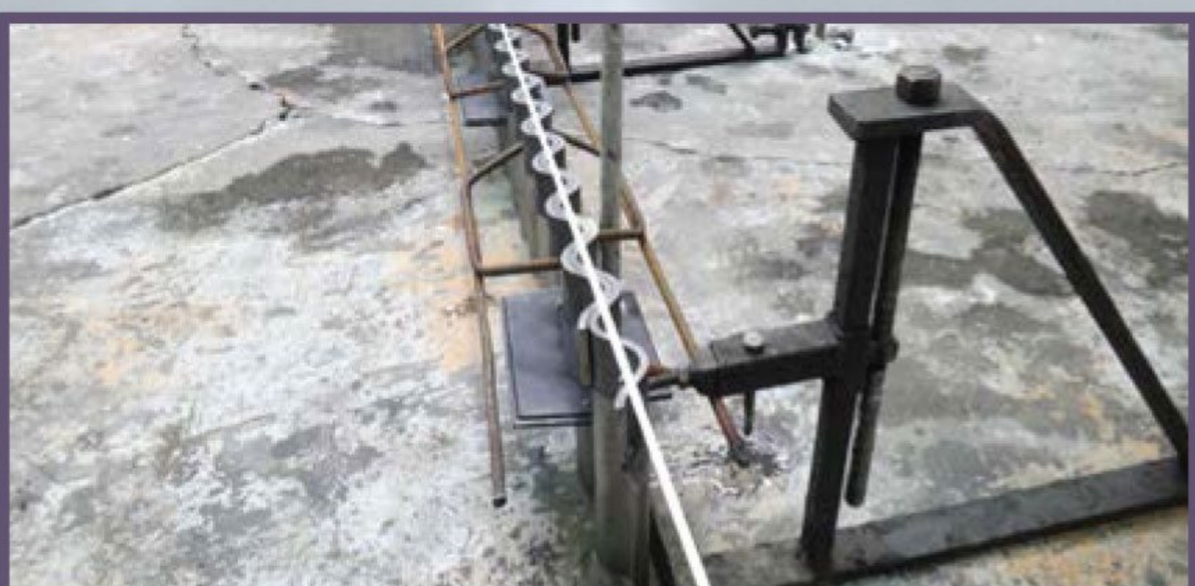
5 Выравнивание опалубки выполняется путем натягивания шнуровки и подгонки в одну линию.