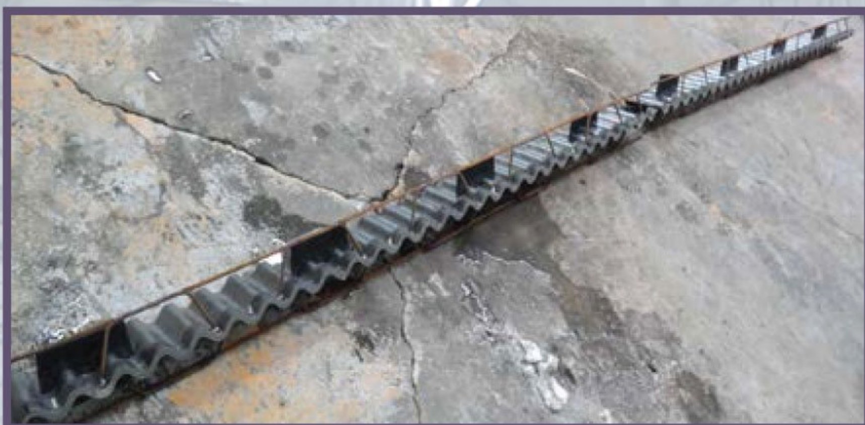
2 Раскладываем опалубку по периметру бетонированной карты в одну линию «стык в стык»