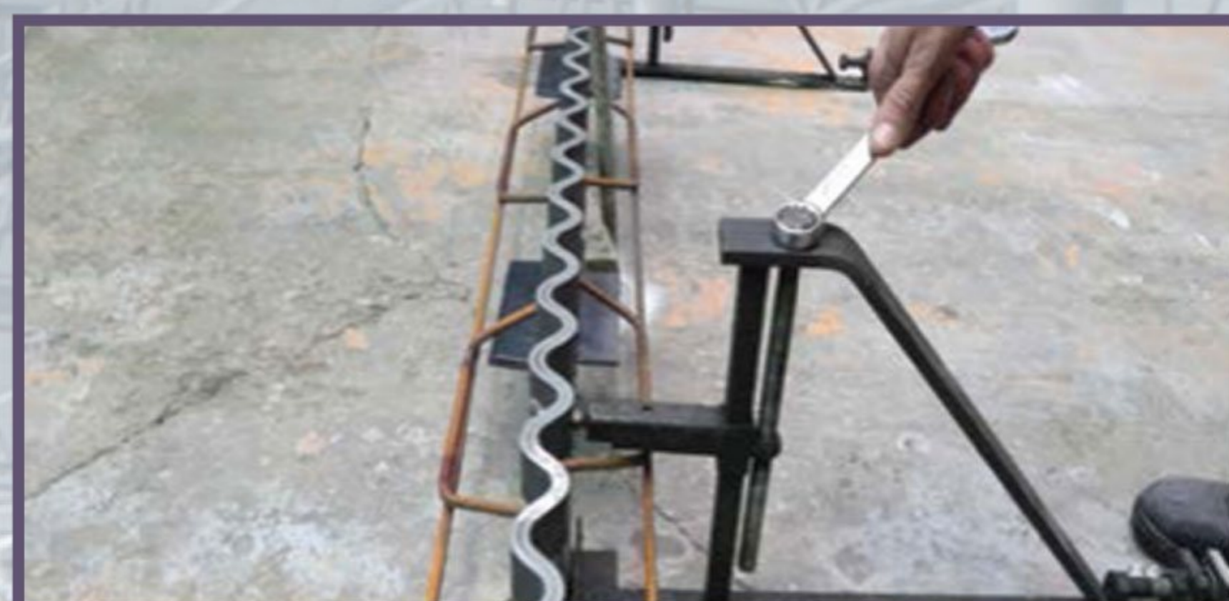
7 Установка опалубки в проектное положение с помощью нивелира и регулировка ключом вертикального положения.