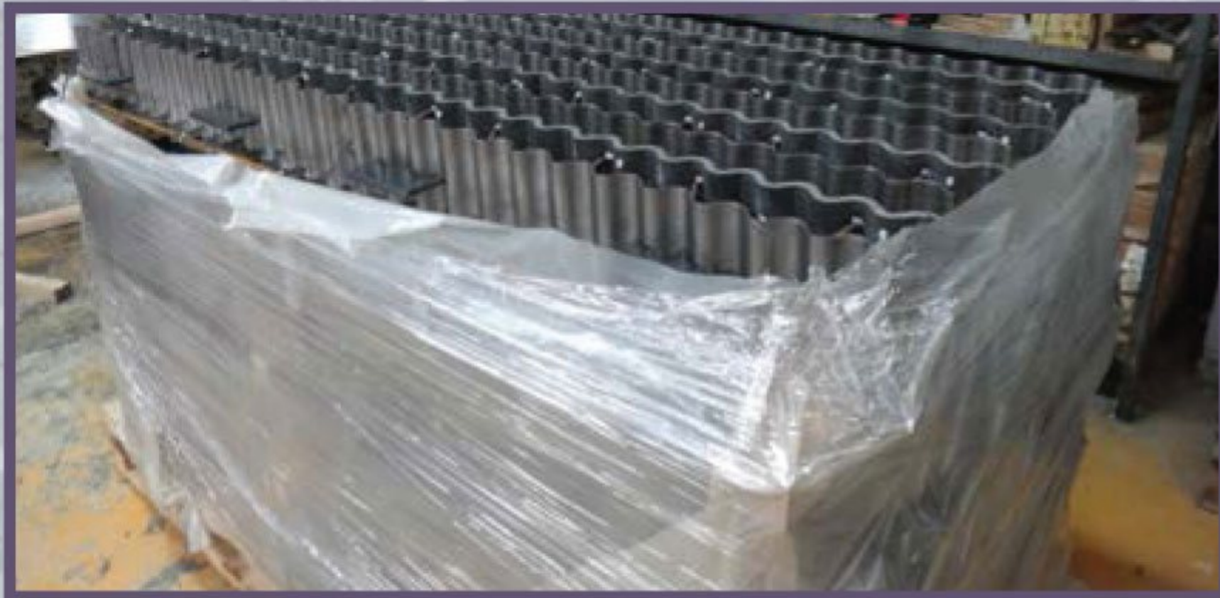
1 Распаковка опалубки