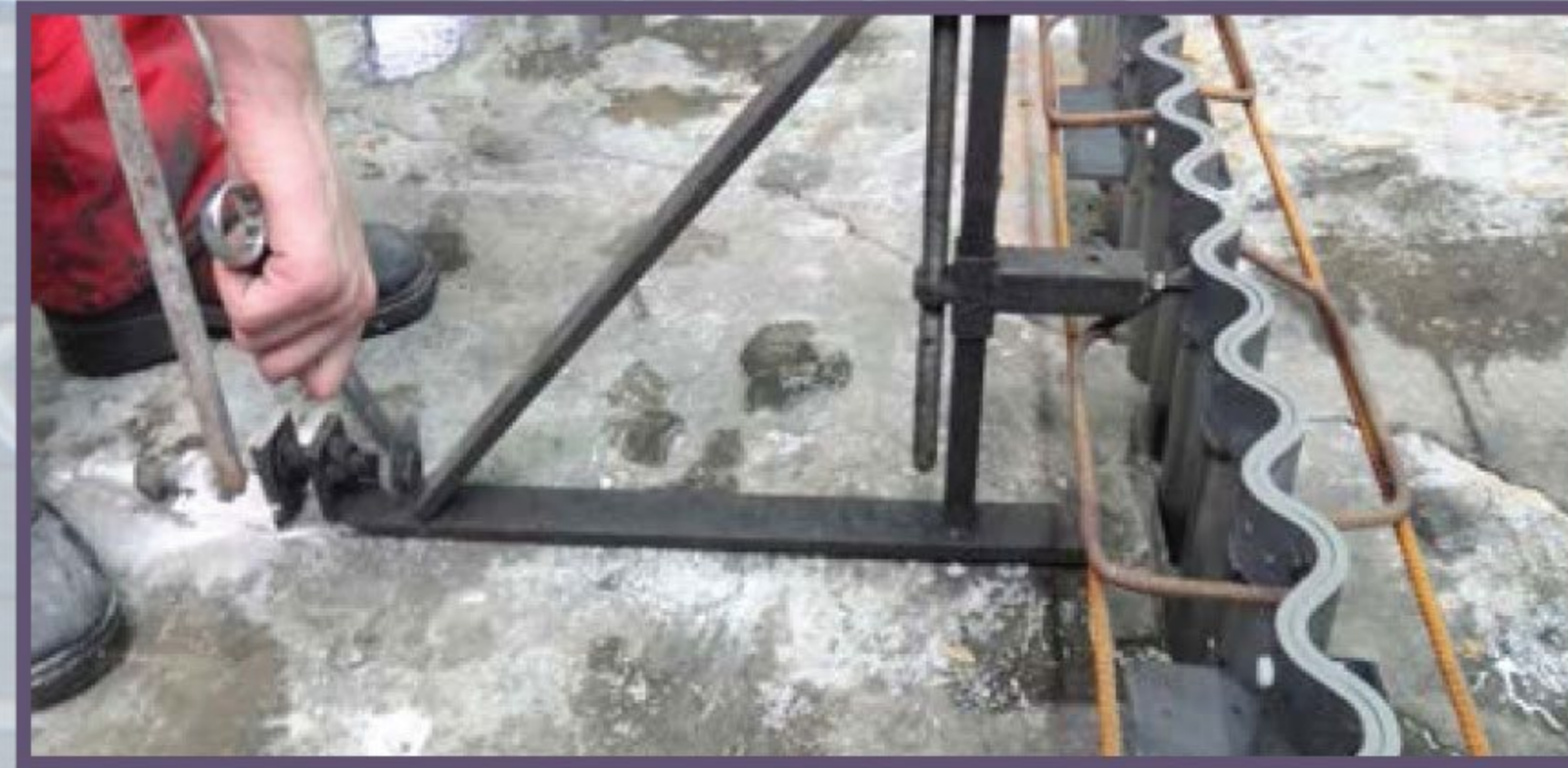
6 Регулируем опалубку ключом в горизонтальной плоскости