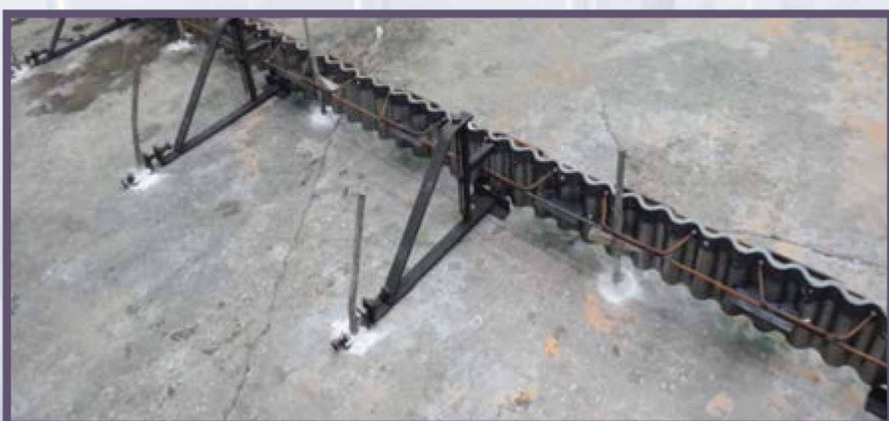
4 Монтаж и крепление фиксаторов должно быть с шагом 1,5 метра. В фиксаторы вставляются штыри из гладкой арматуры диаметром 20 мм (арматурные стержни), которые крепятся в основании. Если необходимо, можно установить дополнительные штыри между фиксаторами. Штыри крепятся к фиксатору при помощи болтового зажима